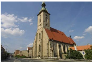
St. Martin's Cathedral- Dóm sv. Martina