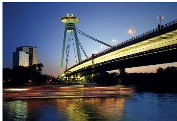
UFO tower and SNP Bridge River Danube – rieka Dunaj