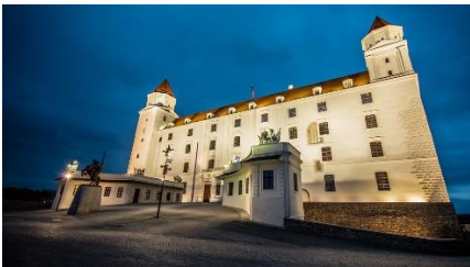
Bratislava Castle - Bratislavský hrad

Do zošita napísať 5-6 viet o Bratislave. Pomáhať si U str.59 a PZ str.55.