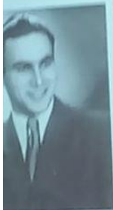
1947-1950 Maybank, Massachusetts